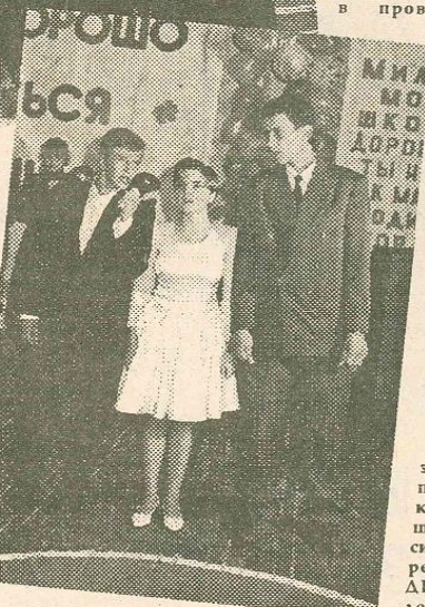
этого праздника. Большое спасибо директору ДК железнодорожников

Педагогический коллектив школы благодарен всем, кто помог школе в проведении